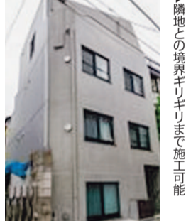
▲隣地との境界ギリギリまで施工可能

元日マテール(神奈川県藤沢市)が2014年から提供する鉄筋コンクリート外断熱『ガンバリ工法』は、都市部の住宅建築に適した工法だ。21年5月末時点で60棟の物件に採用している。