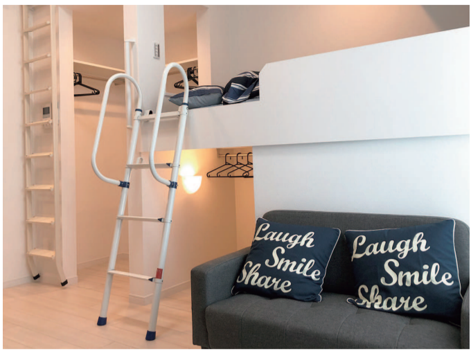
▲セミダブルサイズのベッド下に収納スペースを設けた『キャビン』